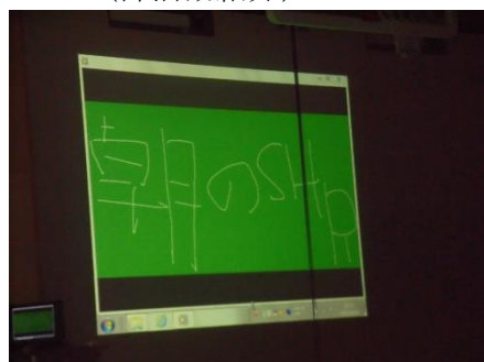
(中学校生活の紹介ビデオ)