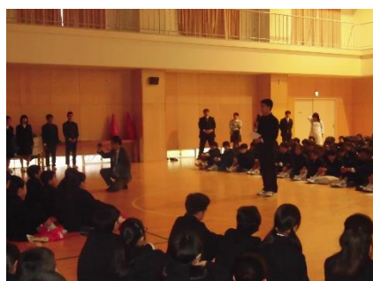
(中学校生徒会長から)