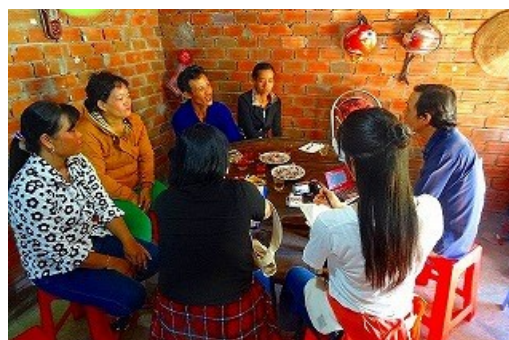
平成28年度メコン川フィールドワーク inベトナム(冬)