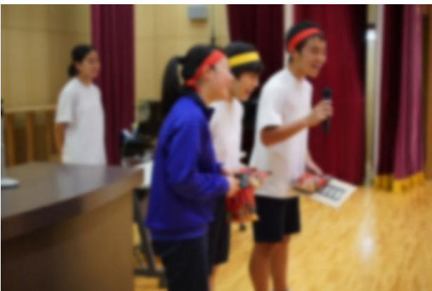
表彰式 恒例のパフォーマンス