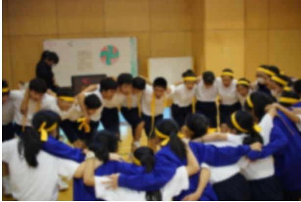
クラス全員での円陣！！