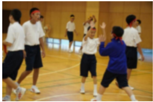
全クラス同点となった1年生