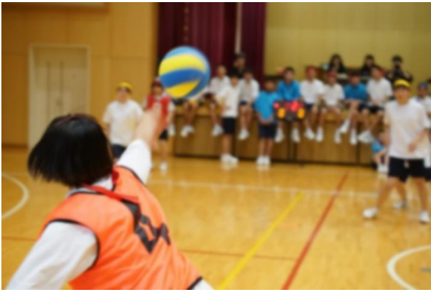
最後の最後まで盛り上がった3年生