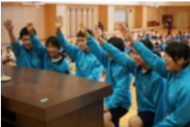
3年体育行事委員による選手宣誓