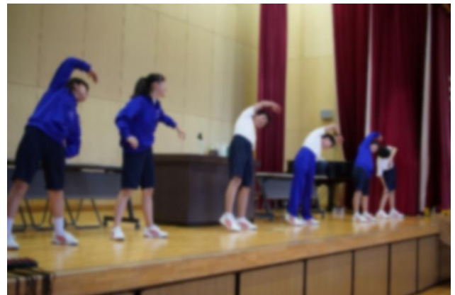
実行委員による二華体操