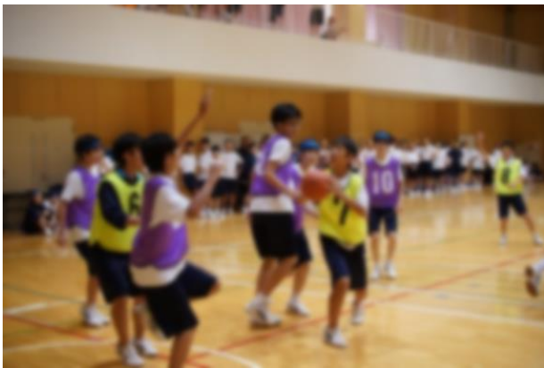
白熱した試合が続いた2年生