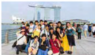
(平成31年の研修の様子)