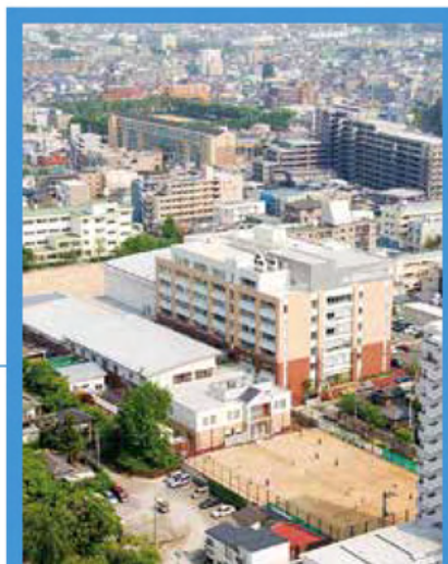
宮城県仙台二華中学校・高等学校

JR 『JR仙台駅』から徒歩15分 バス 『五橋駅』または、『五橋一丁目』から徒歩7分