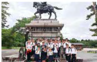
(平成31年度の交流の様子)