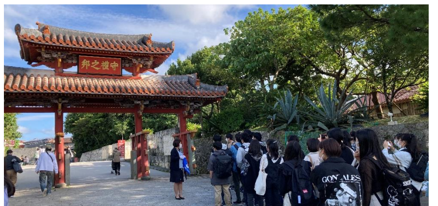
首里城の守礼門の前で話を聞く生徒達