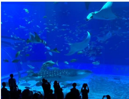
美ら海水族館のジンベイザメ