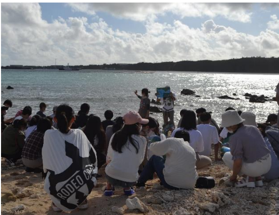
辺野古基地の説明を受ける生徒達