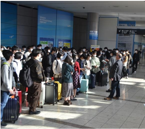
仙台空港にて出発式

令和3年度の本来の研修先はシンガポールでしたが、行き先を沖縄に変更して実施しました。本校は研修旅行を学校生活における最大の学びの場の1つであると考えており、コロナの流行により多くの学校が修学旅行を中止・変更する中、直前まで実施の方向で調整してきました。幸いにも10月以降に国内感染者が急減したことで無事に実施することができ、非常に有意義な研修が行えました。保護者の皆様方のご理解とご協力があったからこそ成果であったと考えています。本当にありがとうございました。