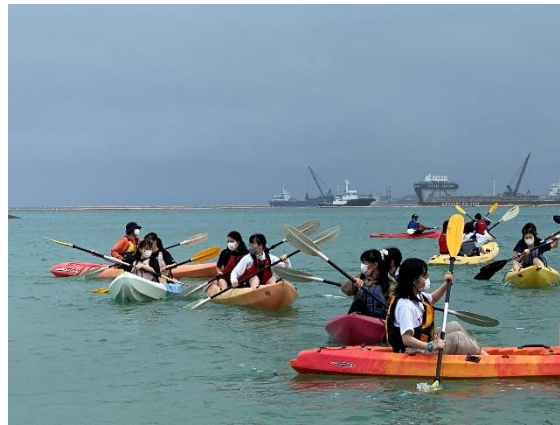
大浦湾でシーカヤックに挑戦