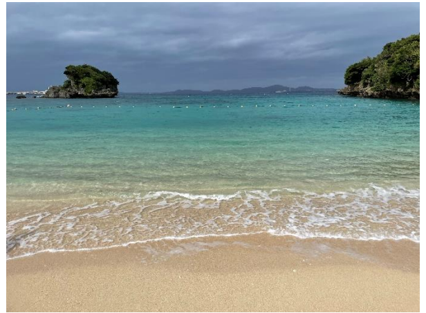
美しい伊計島のビーチ