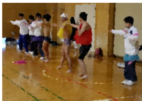
いつも愉快的な水泳部♪