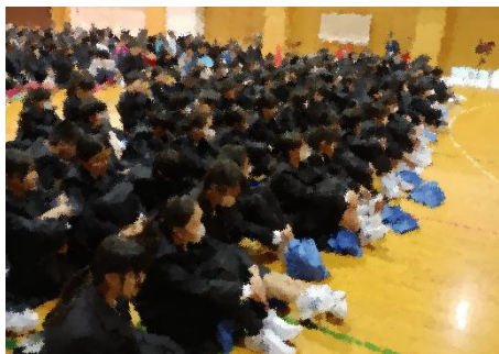
先輩の説明に聞き入る新入生

4月13日(月)に生徒会入会式が行われました。5校時は、高校と合同で年間行事の紹介動画を視聴し、6・7校時は第二体育館に会場を移して中学校生徒会執行部が企画した学校生活動画の視聴と部活動紹介を見学しました。2・3年生の具体的な説明に、1年生はこれからの学校生活をイメージすることができたようでした。その後、縦割り活動の「みちのく交流プロジェクト」に取り組みました。1年生のにこやかな表情も見られ、先輩・後輩の絆づくりの和やかなスタートを切ることができました。