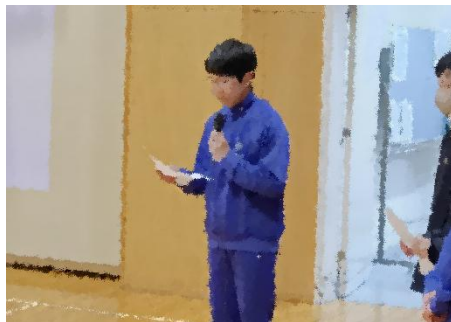
生徒会長のあいさつ