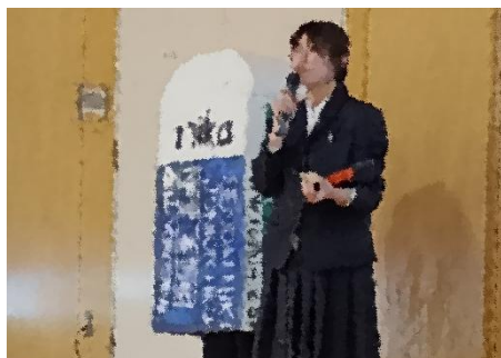
美術部の力作、巨大消しゴム