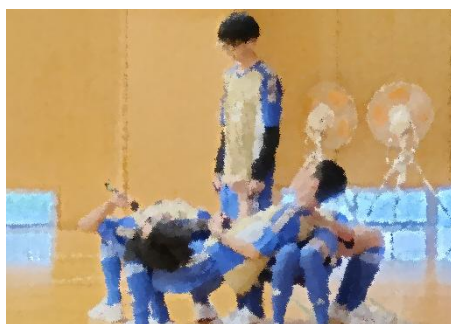
サッカー部、鍛えた体幹披露！