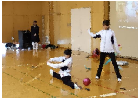
華麗な演技、新体操部