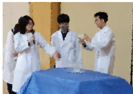
実験披露の自然科学部