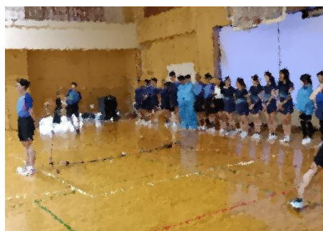
バドミントン部のドライブ